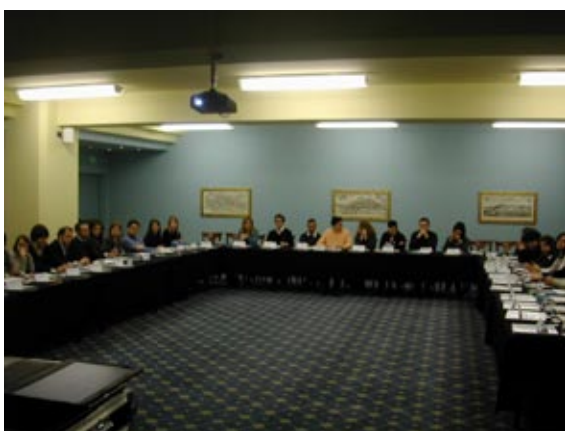
L'Aula presso l'Hotel Cavalieri

Tema di questa edizione La leadership nei momenti di crisi la crisi da evento negativo a opportunità