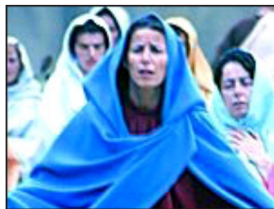
Immagini della rappresentazione sacra “La Passione di Cristo” di Sordevolo (BI)