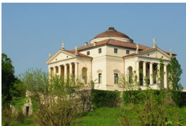
Andrea Palladio "la Rotonda" Vicenza