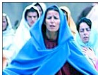
Immagini della rappresentazione sacra “La Passione di Cristo” di Sordevolo (BI)