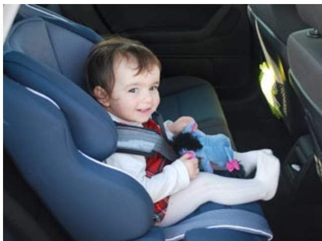
Matilde (18 mesi) nipotina di Nonno Uccio (Porro)