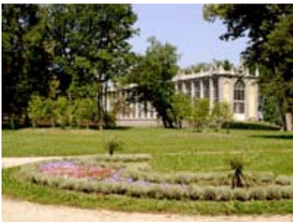
La Margaria del Castello di Racconigi

Il primo, l'IDIR sulla Leadership e sull'Espansione e Sviluppo dell'Effettivo si è svolto il 12 settembre presso la Margaria del Castello Reale di Racconigi.