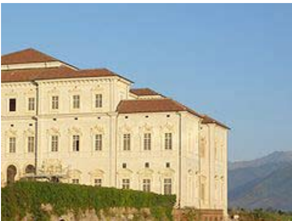
La Reggia di Venaria Reale - particolare

Il secondo, l'IDIR sulla Rotary Foundation svoltosi il 26 settembre presso la Reggia della Venaria.