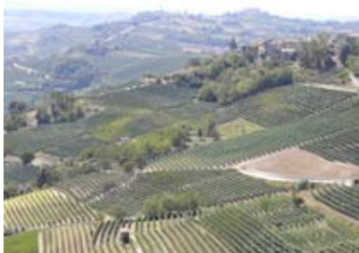
Vue depuis La Morra