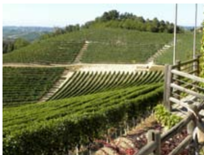
Il vigneto de Verduno

Pour terminer, tous nos amis de Bra nous ont remercié d'avoir un peu "forcé" la main à Cristina pour organiser cette manifestation mais tous ont déploré le peu de participants des Hauts de Siagne.