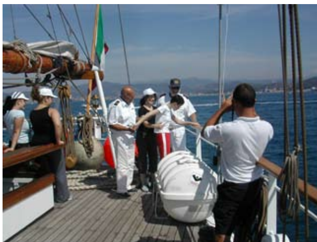
Un’immagine della edizione 2008/2009 a bordo della Goletta Nave Italia

Sono in corso contatti con le controparti per consentire l’organizzazione dell’evento che, che quest’anno giungerebbe alla sua V a edizione.