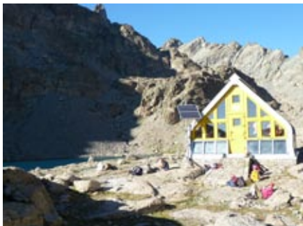
il campo base

Silvano non cessa di sorprenderci con le sue performance sportive. Riportiamo di seguito la "cronaca" della sua ultima avventura alpinistica