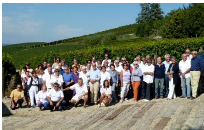
Il folto gruppo dei partecipanti

I soci francesi enchantés per l'accoglienza e noi tutti eravamo ispirati a frequenti brindisi dalla generosa varietà dei vini e dalla contemplazione delle vigne generatrici che ci circondavano come una geometrica scacchiera, come una mappa formata da colture secondo antichi saperi.