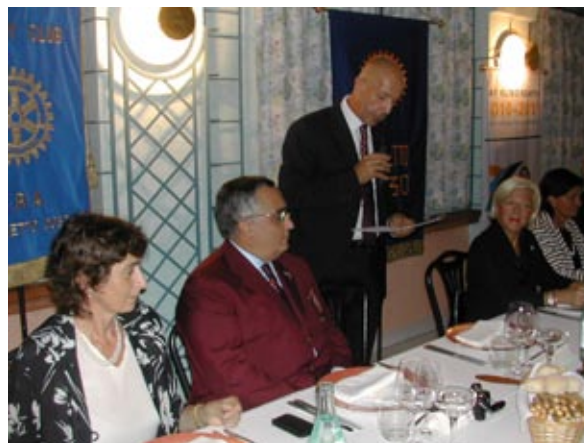
Il Presidente porge il saluto del Club

tembre. Con lui, prima il Direttivo e le Commissioni, poi tutti i Soci hanno potuto dibattere le varie problematiche generali e di Club, ascoltare i suoi suggerimenti le sue considerazioni. Sono nati spunti di riflessione per realizzare in modo più efficiente ed efficace ciascuno nel proprio ambito in seno al Club la propria partecipazione attiva: