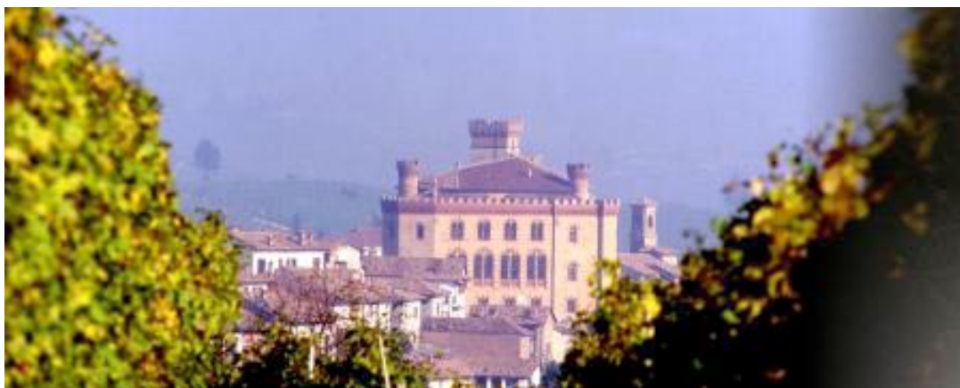
Il Castello di Barolo

Martedì 28 settembre, in un terso pomeriggio di luce preautunnale, all’ombra delle colline barolesi e nella raffinata cornice della azienda “TERREDAVINO” in regione “Cannubi”, si è tenuto l’incontro con il Rotary club di Savigliano sul tema “L’Alimentazione come prevenzione di malattia.....”. sito ufficiale del Comune di Barolo.