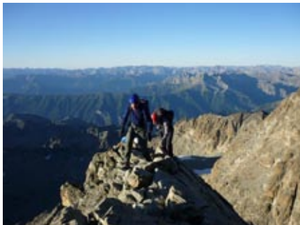
un passaggio impegnativo