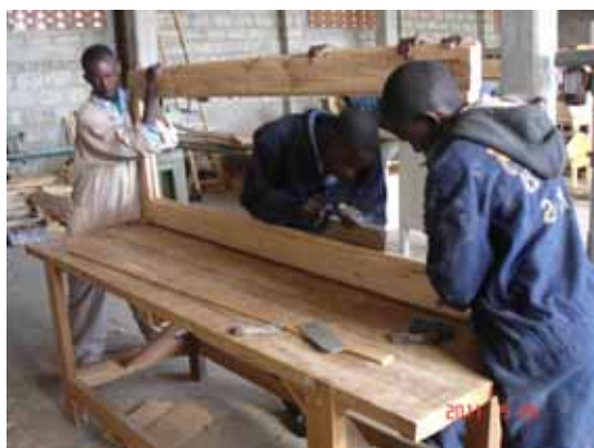
La fabbricazione delle porte interne

Per quanto attiene il progetto della formazione professionale dei ragazzi e della conseguente costituzione di una squadra di artigiani (muratori-carpentieri in legno e falegnami – fabbri - idraulici-elettricisti) recenti contatti con un esponente di un RC di Nairobi lascia intravedere la possibilità di poter condividere l'azione con i RC della Capitale keniana (ben 12) che affiancherebbero l'iniziativa e garantirebbero anche future commesse ai neo artigiani usciti dalla scuola dei mestieri a fronte dei molteplici interventi che il Rotary locale sta realizzando nel proprio territorio