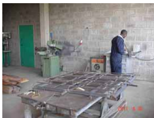
delle inferriate per le finestre

Intanto a Ndaragwa, come documentato dalla serie di fotografie, proseguono i lavori di costruzione del nuovo dormitorio per i ragazzi. Mentre i lavori di muratura procedono celermente, nel laboratorio di artigianato di Harambé (l'Associazione che cura la costruzione del dormitorio) allestito a Naniuki si preparano gli infissi e i serramenti e i laterizi per i divisori interni. La struttura (già totalmente finanziata) è ormai arrivata al tetto e sarà finita, salvo imprevisti, entro il prossimo mese di ottobre.