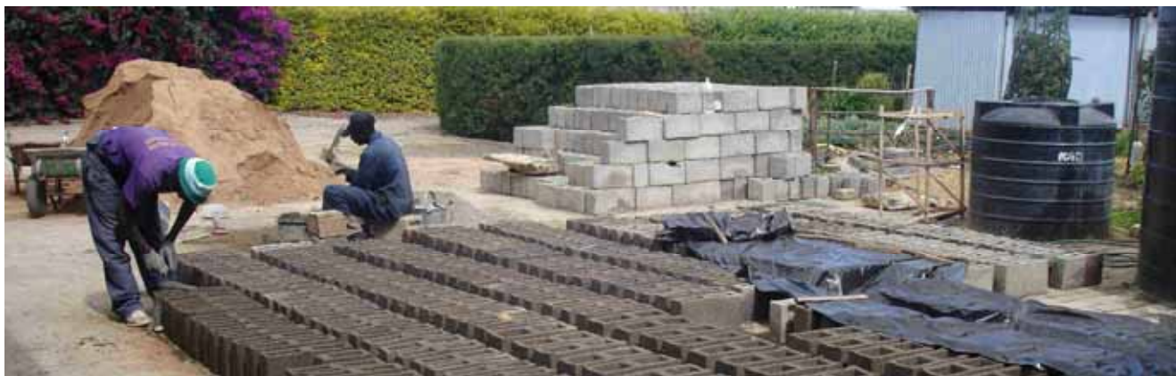
La fabbricazione dei mattoni in cemento per le pareti interne nel "work-shop" di Harambé

portare a breve alla definizione della localizzazione e del dimensionamento dell'investimento e la sua possibilità di finanziamento