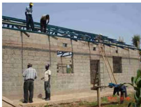
L’avanzamento lavori del nuovo Dormitorio per i ragazzi a Casa Maria

Con le realizzazioni sopradescritte la prima fase del Progetto “Africa Casa Maria” finalizzata principalmente, oltre che al mantenimento dei bambini ospitati nella Cas di accoglienza, alla realizzazione di strutture immobiliari e di impianti e attrezzature potrà considerarsi conclusa.