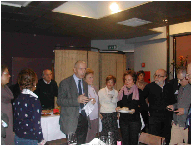
Il saluto del Presidente